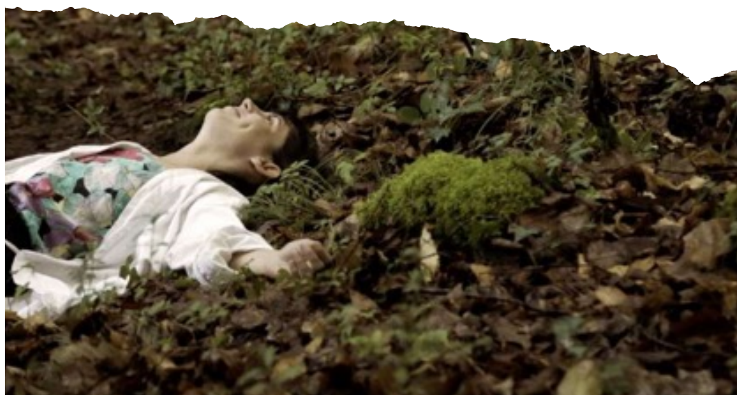
Sortie de résidence

Mais alors, dit Alice, si le monde n'a absolument aucun sens, qui nous empêche d'en inventer un ? Lewis Carroll