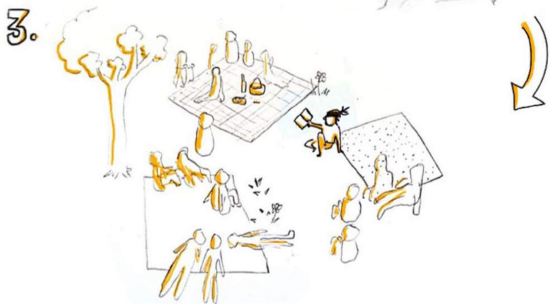
Illustration © Élie Girard