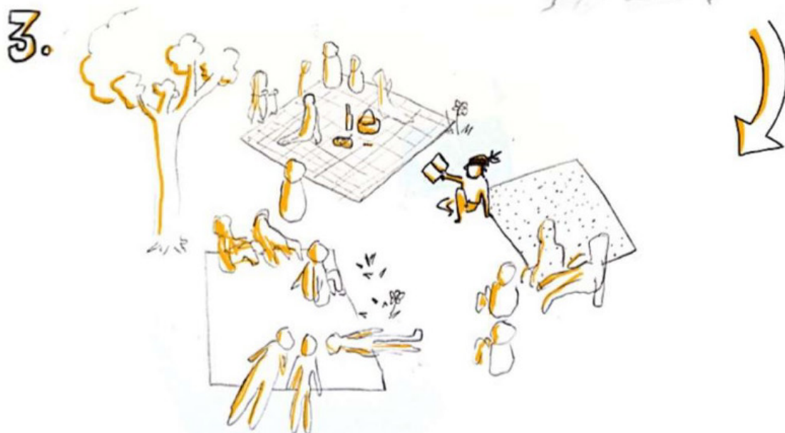
Illustration © Élie Girard