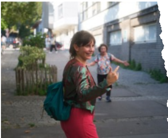
Sortie de résidence

Cette emardée est une fugue vers le vrai monde du dehors, regardé avec avidité et rendu à sa beauté. Tout est vivant, vibrant. Et l'environnement retrouve son caractère imprévisible. On découvre que la végétation se glisse partout où elle peut, figure de résistance. Les plantes ont des noms fabuleux et des facultés grandioses. On regarde mieux ce qui existe. On le célèbre. Et on s'autorise soi-même à exister. À parler fort. À occuper l'espace public. À s'exprimer ! La comédienne fait figure de guide, menant la troupe au son des poèmes qu'elle hurle au Monde, des histoires qu'elle dévoile, de la magie qu'elle révèle.