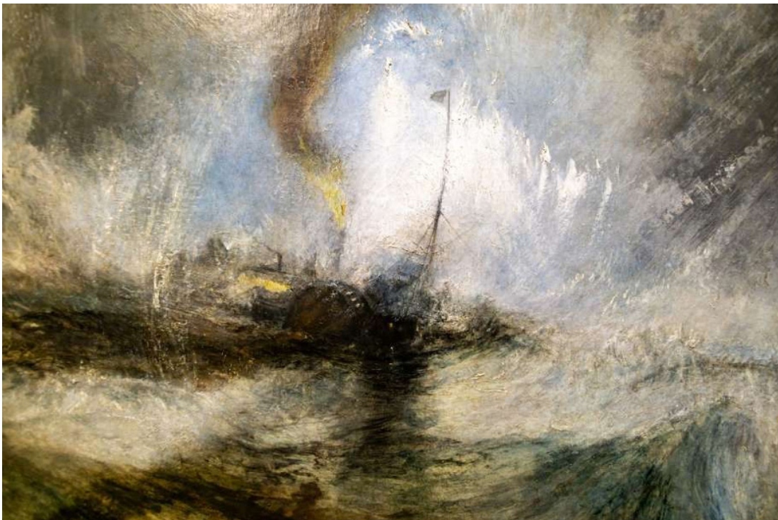
Snow Storm, J.M.W. Turner (1842)

Cette pièce naît de la nécessité absolue de partir en quête de chemins d'émancipation et à l'aventure d'un rapport au monde fait de confiance, de fantaisie, d'échange, de soin et de tendresse.